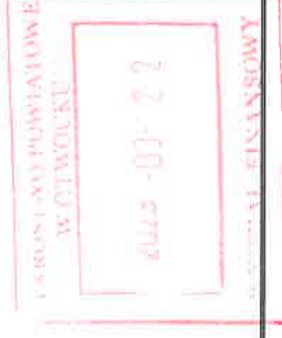
Tabela do poz. II.1.1.