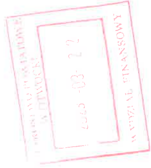
Tabela do poz. II.1.1.