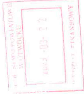
Tabela do poz. II.1.15.